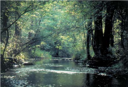
Die Strothe-Talau im Süden der Senne

Als Lebensadern der Senne können die Bachtäler bezeichnet werden, die sich auf einer Länge von rund 55 km nahezu unberührt durch den Sennesand schlängeln. In den Bachtälern haben sich ursprüngliche Bruchwälder und bachbegleitende Auwälder entwickeln können.