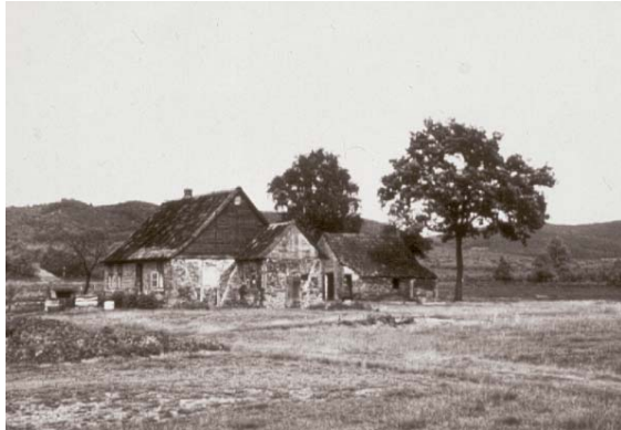
Sennekotten bei Oerlinghausen um 1930

Aber erst billige Wollimporte aus Neuseeland und Australien führten zu einem deutlichen Rückgang der Schafhaltung in der Senne. Und die Entwicklung des Kunstdüngers bedingte schließlich den allmählichen Rückgang der Plaggenwirtschaft zu Beginn des 20. Jahrhunderts.