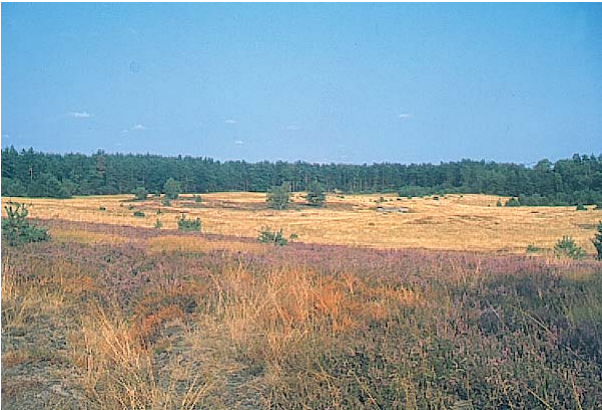
Offene Senne- landschaft bei Haustenbeck

Nachfolgend werden die wichtigsten Biotoptypen der Senne genannt und veranschaulicht, welche Pflanzen und Tiere sich in ihnen wohlfühlen.