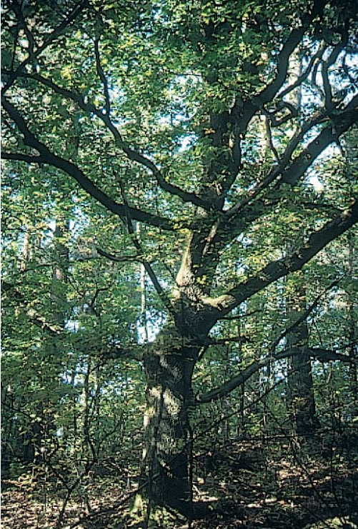
Imposante Eiche am Talhang der Lutter

Wie bereits erwähnt, kann der Nationalpark in zwei Zonen eingeteilt werden. Dabei wird zwischen der Kernzone und der Pflegezone unterschieden.