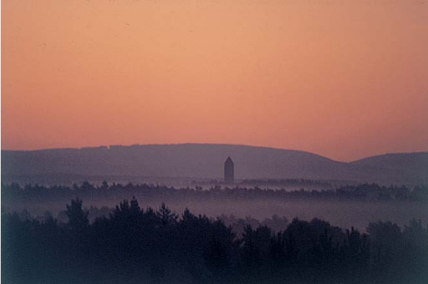
Sonnenaufgang in der Senne