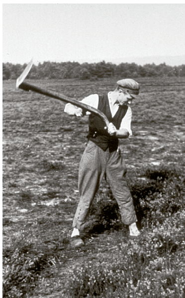
Plaggenbauer in der Augustdorfer Senne um 1930

Die früheren Bewohner der Senne schälten ganze Heidesoden (sogenannte Heideplaggen ) ab, um sie zunächst als Einstreu in ihren Tierställen zu verteilen. Waren diese nach einiger Zeit gut mit tierischem Dung versorgt, wurden sie schließlich als wertvoller Dünger auf die nährstoffarmen Äcker gebracht, auf denen Roggen, Buchweizen, Kartoffeln und Rüben angebaut wurden.