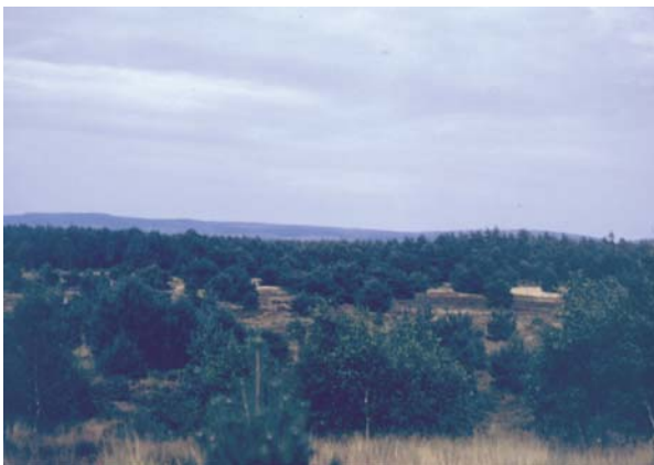
Kiefersukzession im Brunswick

Sind diese Störungen größeren Ausmaßes wie bei Waldbränden, Schädlingsbefall oder Sturmschäden, wird die Veränderung erneut durch Sukzession ausgeglichen.