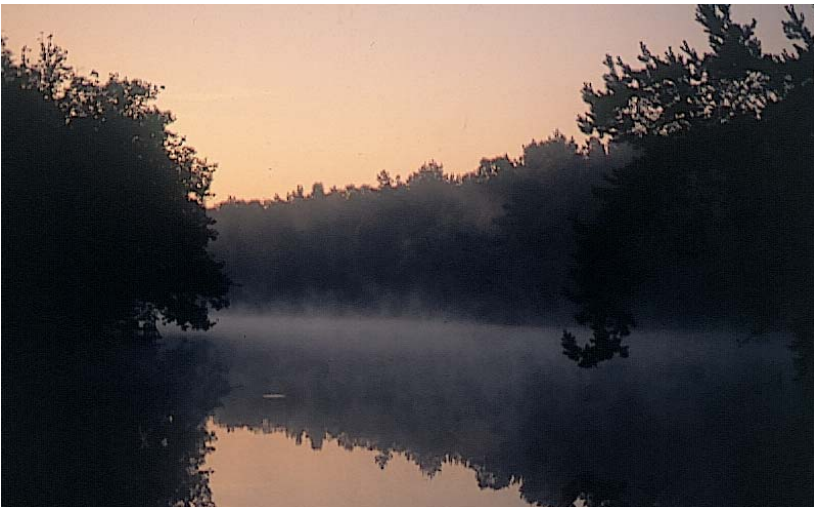
Morgenstimmung am Haustensee