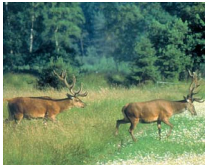
Rotwild in der Senne

Den Schutz der Wälder nutzen auch Damwild, Rotwild, Rehe, Wildschweine, Füchse und Waschbären. In alten, hohlen und manchmal auch schon abgestorbenen Bäumen finden tagsüber verschiedene Fledermausarten Unterschlupf.