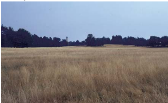
Sandmagerrasen bei Haustenbeck

Neben der Heide existiert mit dem Sandmagerrasen (etwa 500 ha) noch ein weiterer Biotopkomplex, der dem Offenland zugeschrieben wird. Auch er muss ähnlich wie bei den Heideflächen gepflegt werden, um ihn vor Verbuschung und Wiederbewaldung zu schützen. Es handelt sich hierbei meist um ehemalige landwirtschaftliche Flächen, die seit nunmehr einem halben Jahrhundert nur noch sehr extensiv genutzt werden (Beweidung durch Schafe oder Mahd).